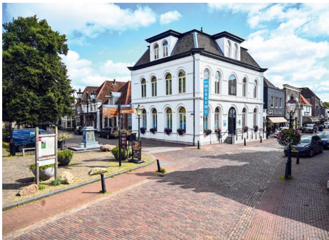
Het Zoutmuseum in Delden : „We willen over het belang van zout voor mensen vertellen.”