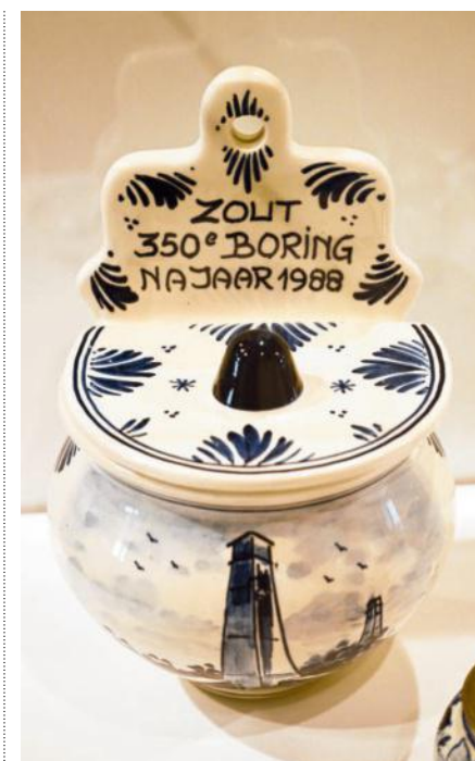
Een van de 1.800 zoutvaatjes .

grootste sponsor is zoutproducent Nobian.